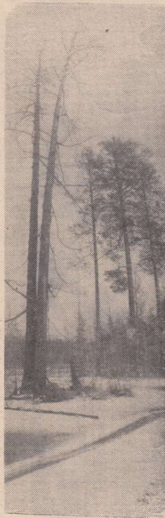
НА ОПУШКЕ.